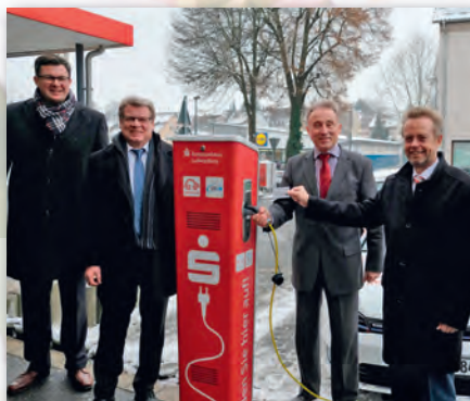
Eröffnung der Stromtankstelle in der Hindenburgstraße

Elektromobilität macht schon heute eine klimafreundliche CO 2 -freie Fortbewegung möglich, Elektro- und Hybridfahrzeuge werden zukünftig in Deutschland zweifellos an Bedeutung gewinnen. Wir möchten in unserem Marktgebiet zu dieser Entwicklung beitragen und den Aufbau der notwendigen Infrastruktur unterstützen. Deshalb haben wir Anfang Januar 2017 bereits unsere zweite Stromtankstelle in Betrieb genommen, welche wir gemeinsam mit den Stadtwerken Ludwigsburg-Kornwestheim betreiben. So leisten wir einen wichtigen Beitrag zum Umweltschutz und gehen in Sachen Klimaschutz mit gutem Beispiel voran. Und selbstverständlich profitieren auch unsere Kunden: Bis auf Weiteres können diese ihre Elektro- bzw. Hybridfahrzeuge kostenlos an der Ladesäule aufladen.