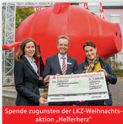
Spende zugunsten der LKZ-Weihnachtsaktion „Helferherz“

2016 haben wir wieder rund 800 Projekte mit Spenden- und Sponsoringmaßnahmen gefördert und dabei zusammen mit den erfolgten Stiftungsdotationen (das Stiftungsvolumen unserer fünf Stiftungen wurde auf 25 Millionen Euro erhöht) rund 3,3 Millionen Euro investiert. Zusätzlich haben die Kreissparkassen-Stiftungen rund 550.000 Euro für Projekte aufgewendet, so dass insgesamt 3,8 Mio. Euro gemeinnützigen Zwecken zugutekamen. So profitiert der gesamte Landkreis von unserem Geschäftserfolg.