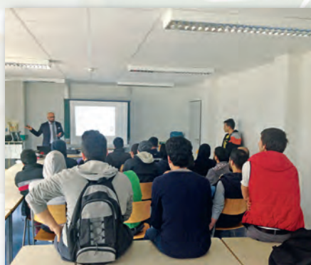
Informationsveranstaltung in der Flüchtlingsunterkunft „Römerhügel“