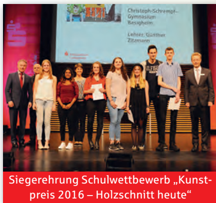
Siegerehrung Schulwettbewerb „Kunstpreis 2016 – Holzschnitt heute“